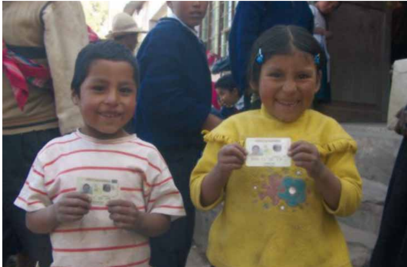
Dos niños obtienen su carné de identidad.

Organización local: INDICEP Cofinanciador: Ayto. de Madrid y Agencia Española de Cooperación Internacional para el Desarrollo Localidad: Municipios de Bolívar, Arque, Sicaya, Tapacarí y Tacopaya (Dpto. de Cochabamba) Presupuesto total: 844.991 euros Subvención: 457.417 euros