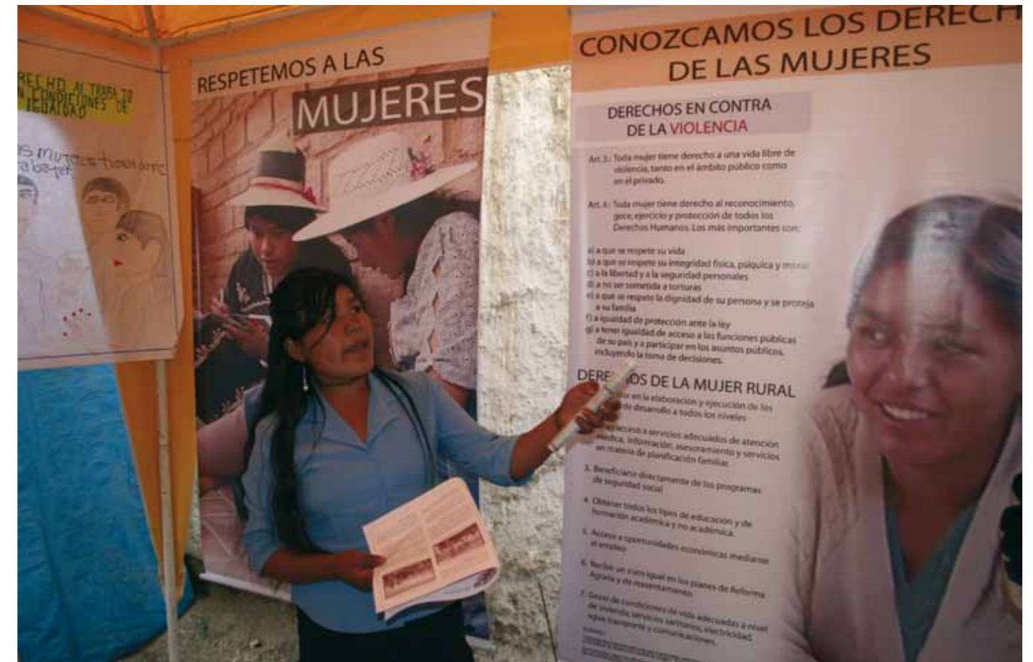
Conferencia sobre los derechos de la mujer