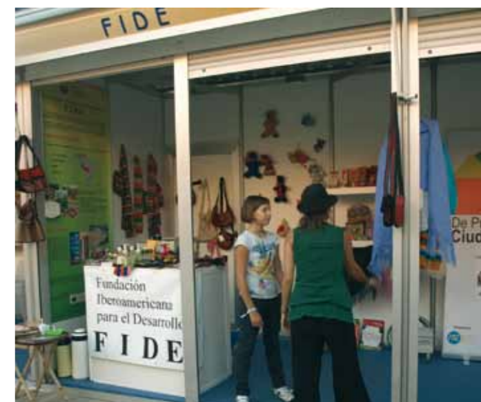
Semana de la Solidaridad en Ciudad Real

Las principales acciones en las que FIDE ha participado en 2009 junto con otras entidades han sido: