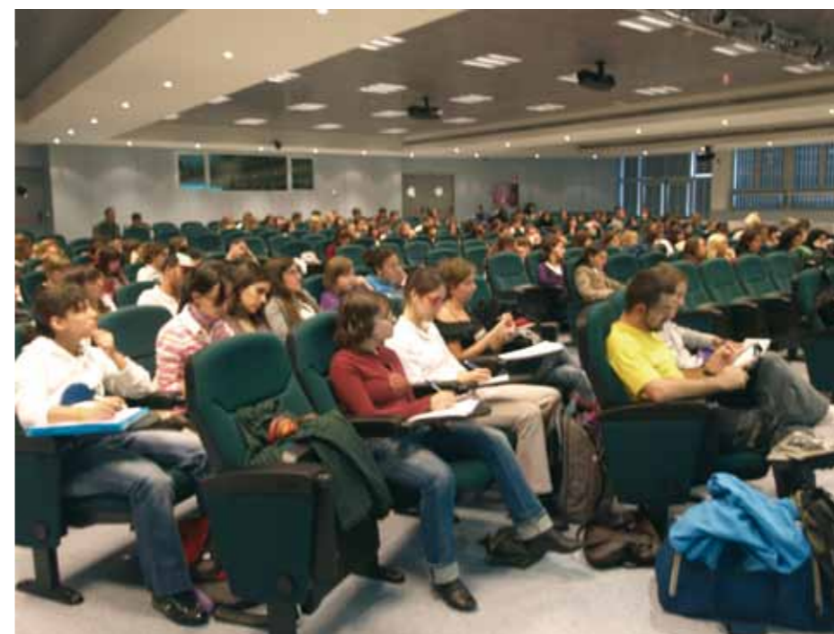
Asistentes a las jornadas en la Universidad Autónoma de Madrid

La página incluye materiales didácticos, libros, artículos, experiencias y enlaces a otras páginas. Los recursos están organizados por asignaturas. Muchos de ellos pueden ser descargados. Fundamentalmente está dirigida a educadores que intervienen con niños.