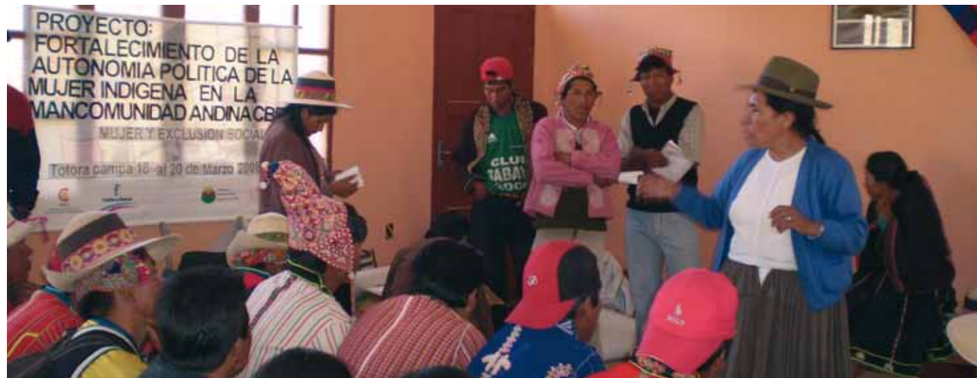
Taller para técnicos municipales sobre género