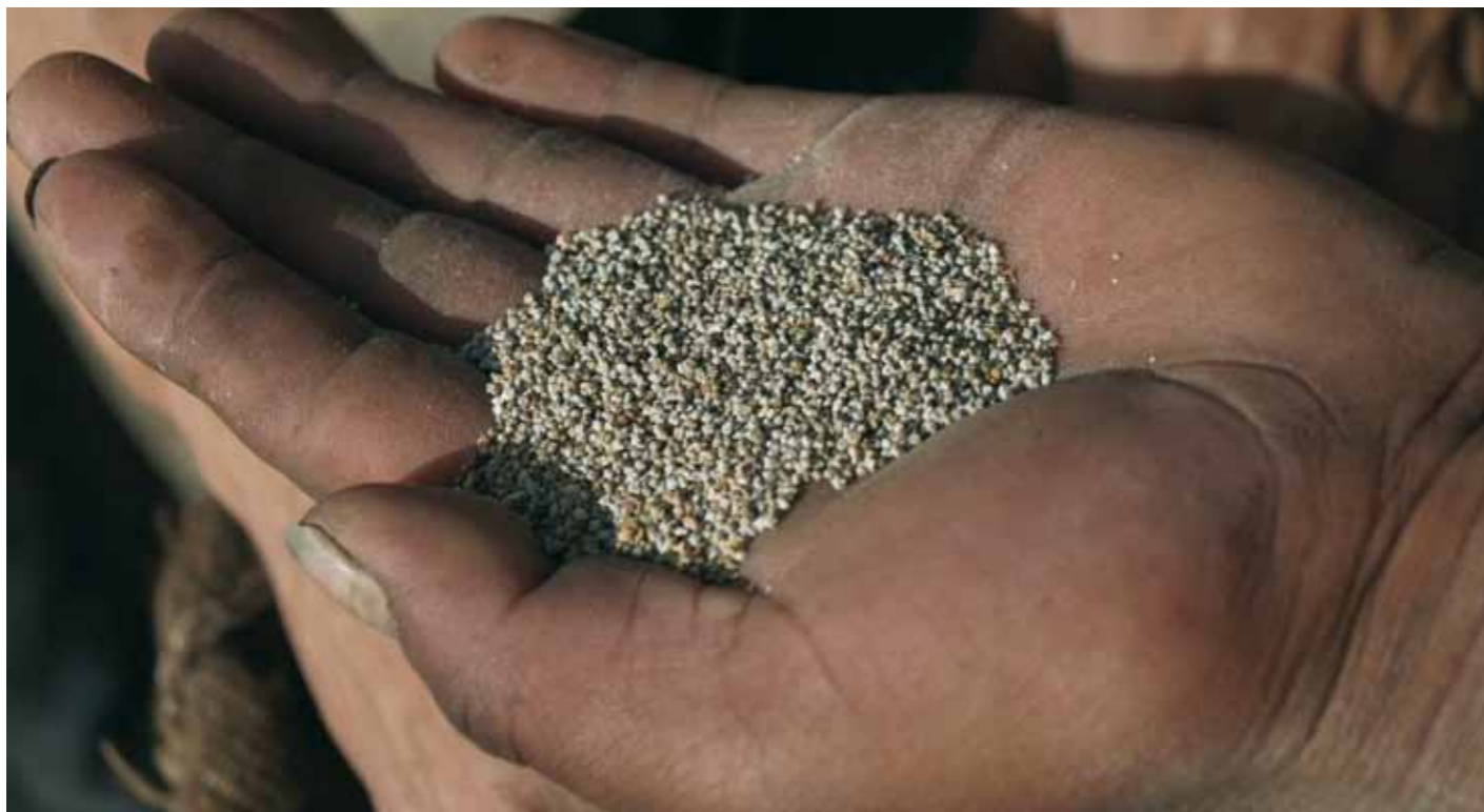
La cañahua, cereal tradicional indígena.