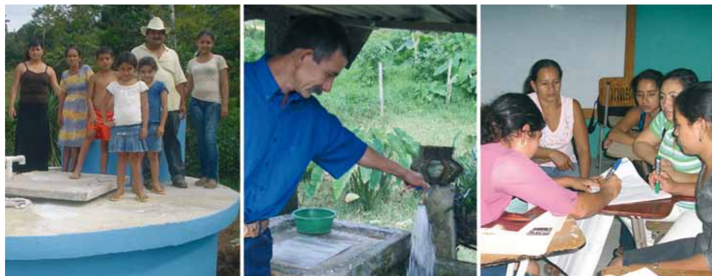
Tanque para la distribución de agua potable.