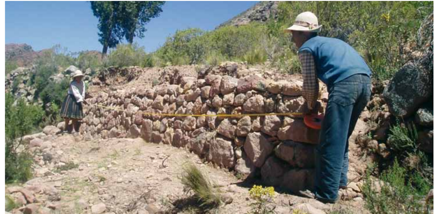
Construyendo terrazas para la conservación del suelo.