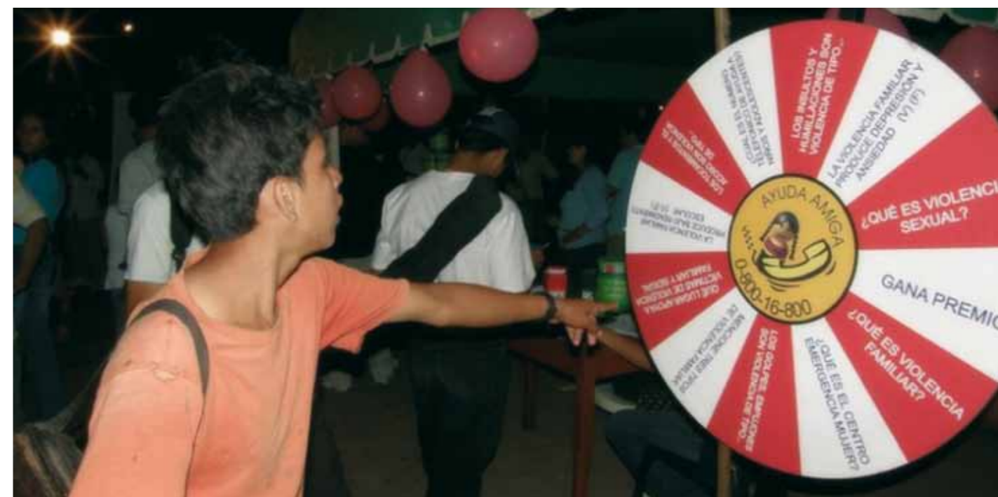
Acto de calle para sensibilizar sobre la violencia de género