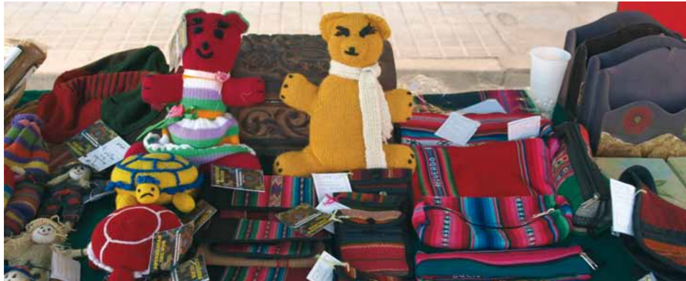
Algunos de los productos de artesanía boliviana

Cofinanciadores: Instituto de Consumo (Junta de Comunidades de Castilla-La Mancha) Subvención: 12.000 euros