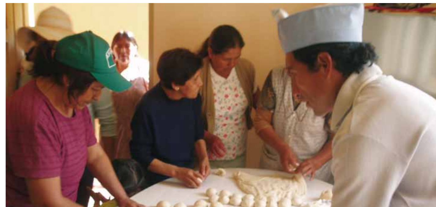
Taller de cocina