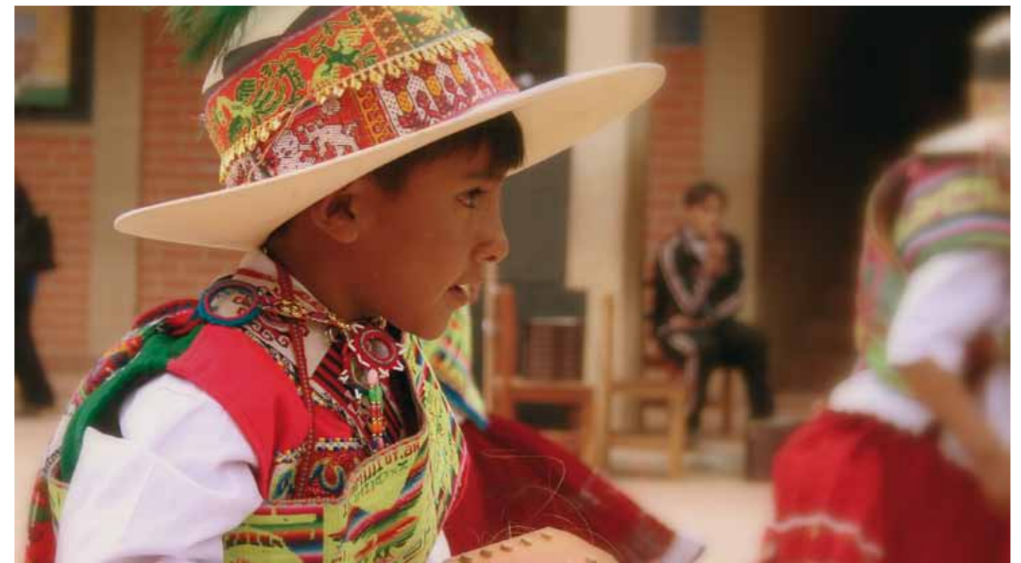
Festival de música y teatro populares en una escuela.