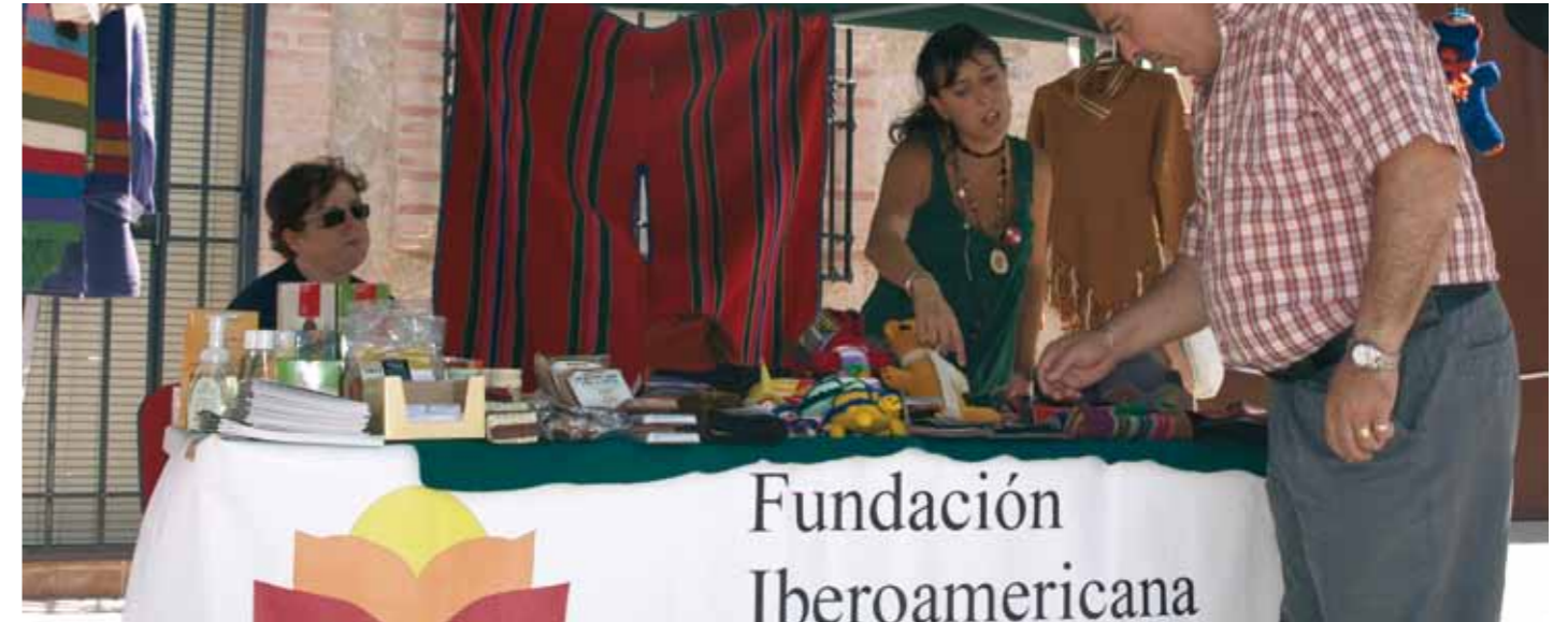
Feria de comercio justo en Mota del Cuervo (Cuenca)