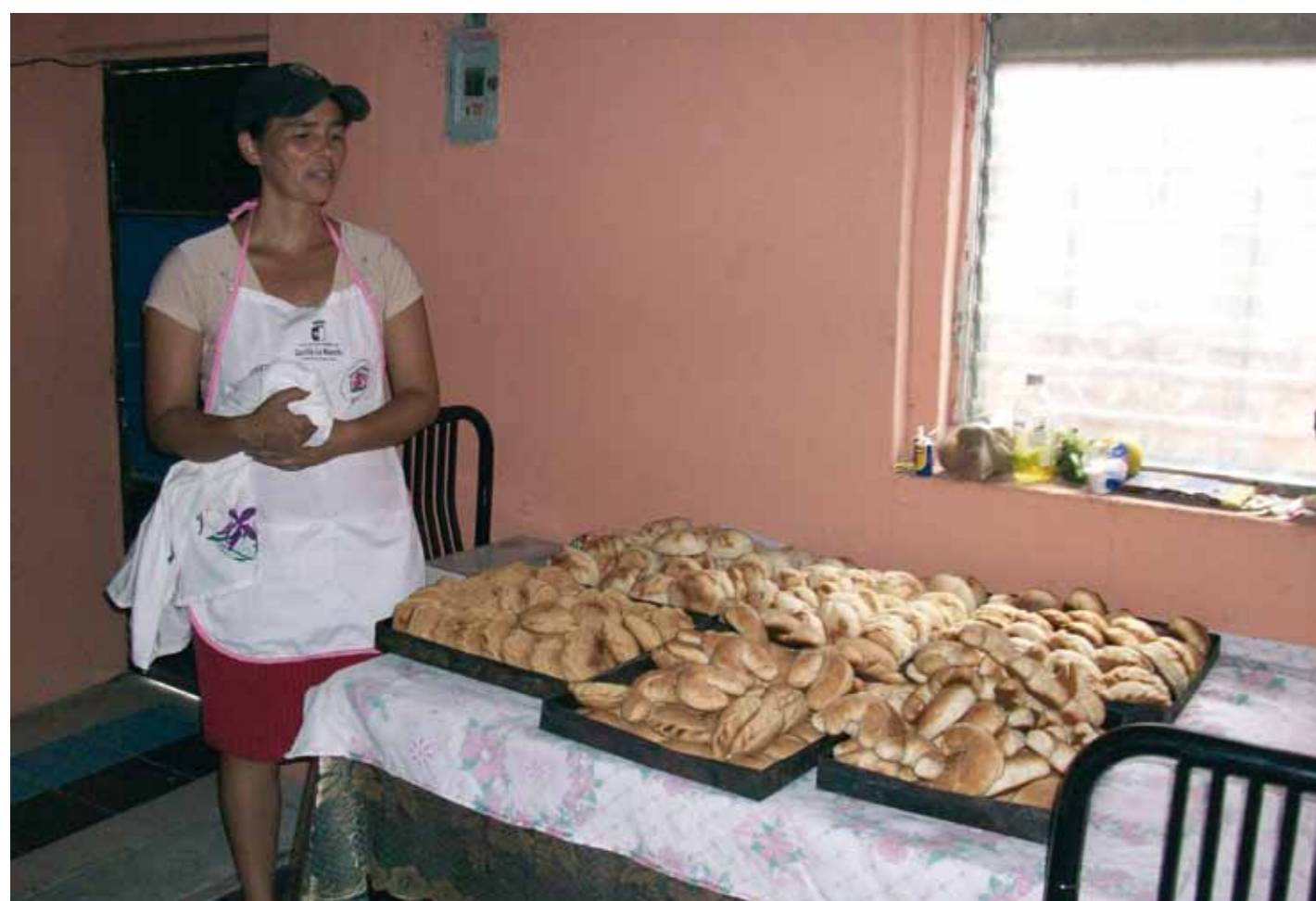
Una de las empresas creada por mujeres.